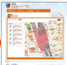
▲公式サイト掲載例